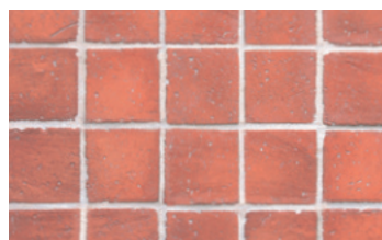
057 Brick Piccoli