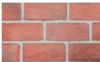
056 Brick Garda